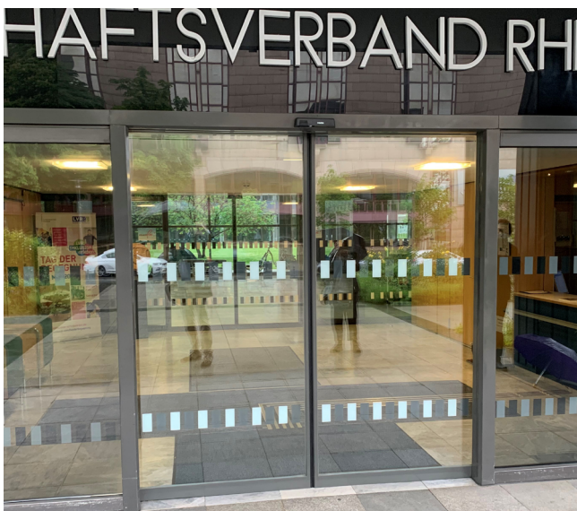
Abb. 4: Glassicherheitsmarkierung auf zwei Höhen zum Erkennen beim Blick nach vorne oder unten