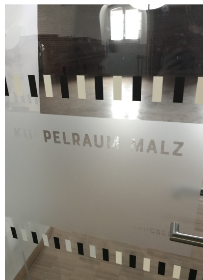
Abb. 5: Detailansicht einer Glassicherheitsmarkierung