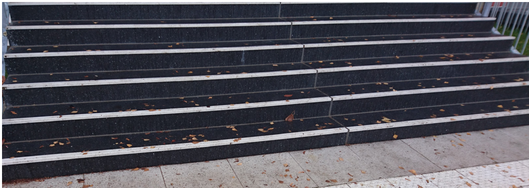
Abb. 2: Stufen-Vorderkanten-Markierung

Auf der Wegeführung zum Wahlraum einschließlich der notwendigen Rettungswege sind die wichtigsten Markierungen zur Barrierefreiheit vorzunehmen bei Treppen, einzelnen Stufen und Glastüren sowie, falls nicht vorhanden, die Markierung von PKW-Stellplätzen für schwerbehinderte Menschen. Die nachfolgenden vier Abbildungen zeigen die Markierungen in ihrer Anwendung gemäß DIN 18040-1 „Barrierefreies Bauen – Planungsgrundlagen – Teil 1: Öffentlich zugängliche Gebäude“ und DIN 32975 „Gestaltung visueller Informationen im öffentlichen Raum zur barrierefreien Nutzung“.