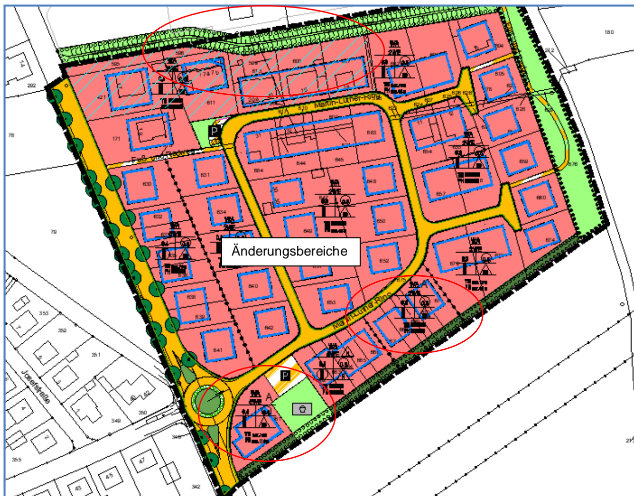
Änderungsbereich des Bebauungsplanes

Die Änderungsbereiche umfassen den Lärmschutzwall zum Gelände des städt. Baubetriebshofes (Gemarkung Erwitte, Flur 8, Flurstücke 597 und 612), ein an den Lärmschutzwall angrenzendes bebautes Grundstück (Gemarkung Erwitte, Flur 8, Flurstück 611) sowie die westliche und östliche Reihenhausgruppe (Gemarkung Erwitte, Flur 8, Flurstücke 661 bzw. 667 bis 671) am Südrand des Geltungsbereiches. Die Änderungsbereiche haben insgesamt eine Größe von ca. 5.300 m 2 .