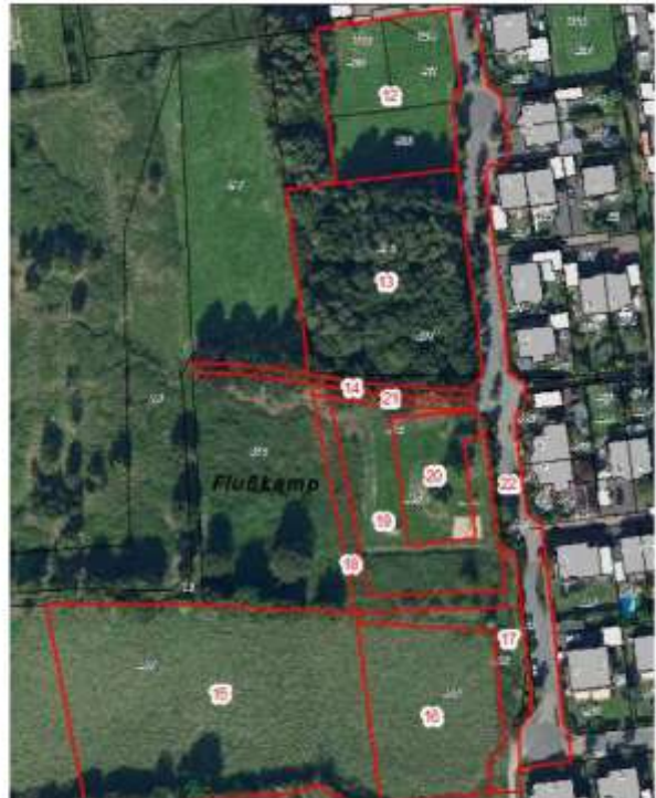
Abbildung 1: Abgrenzung der Biotoptypen für die Eingriffsbilanzierung, links Bestand, rechts Planung, Fläche Nr. 12 ist für den temporären Ersatzspielplatz vorgesehen, Fläche 20 umgrenzt das mit einer Grundflächenzahl von 0,3 überbaubare Grundstück (Abbildung vom Planungsbüro Berger, Ingenieurbüro W. Klein)